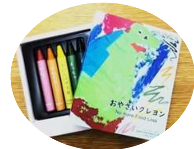
< おやさいクレヨン >