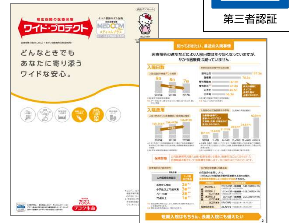
＜「ワイド・プロテクト」特設サイトイメージ＞